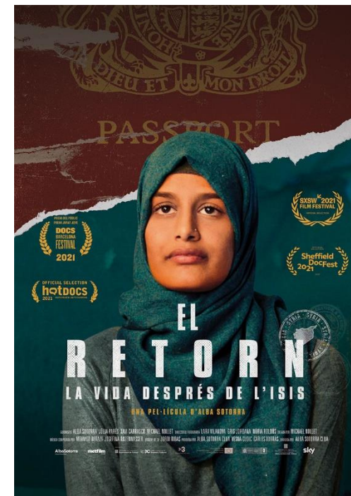
EL RETORN, LA VIDA DESPRÉS D'ISIS 2021, 90min. VOSCatalà