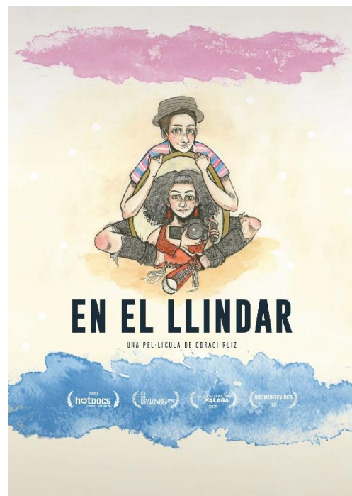
EN EL LLINDAR 2020, 77min. VOSCatalà