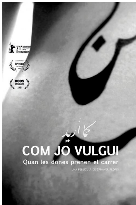
COM JO VULGUI 2021, 88min. VOSCatalà