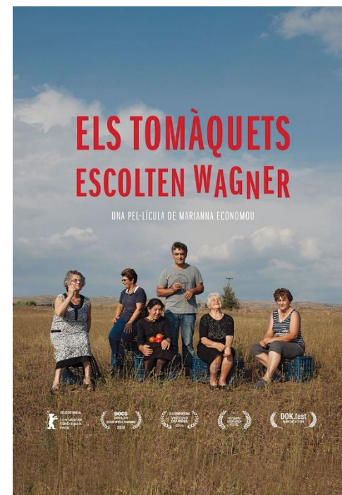
ELS TOMÀQUETS ESCOLTEN WAGNER 2019, 72min. VO Català