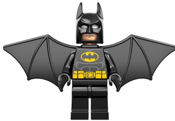
Individual (Aula EE)