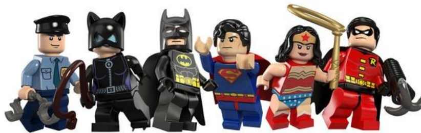
Gran grup (aula)