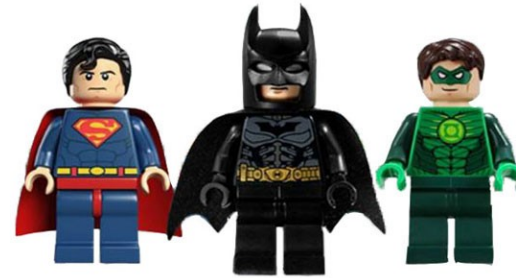
Petit grup (reforç)