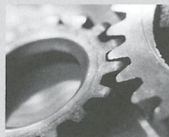
(Quadre 2. Punts de referència per planificar les propostes d'intervenció.)