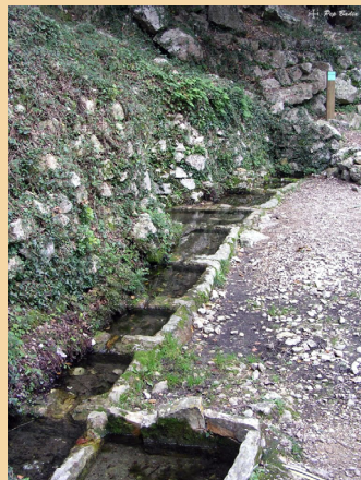
Font del Burgar

També trobem un altre tipus de fonts, les "foggara", sempre situades al mig del llit d'un barranc, que recullen les aigües escasses que hi ragen subterràniament per portar-les a una piqueta, sovint protegida per una barraca de pedra en sec per mantenir l'aigua en bones condicions i evitar la seva evaporació (Fontanella, Andara...)