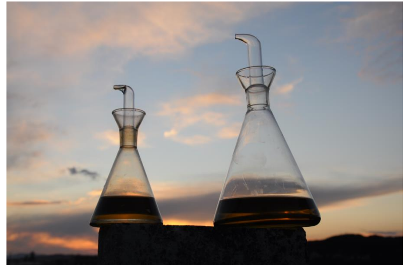
Setrills cònics proporcionals