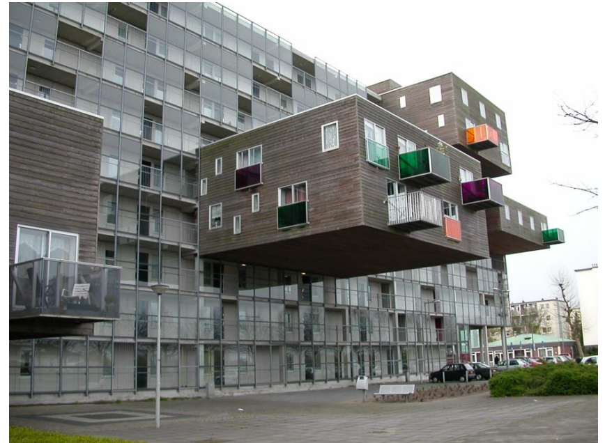
Ortoedres en suspensió