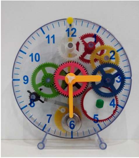
L'angle recte del temps