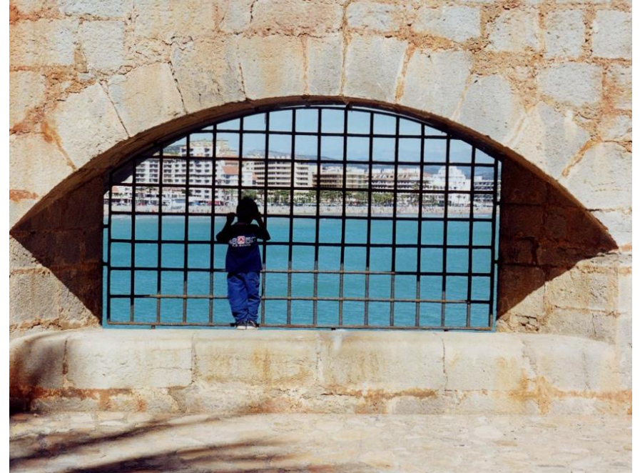
Mirant el mar pel (6,4)