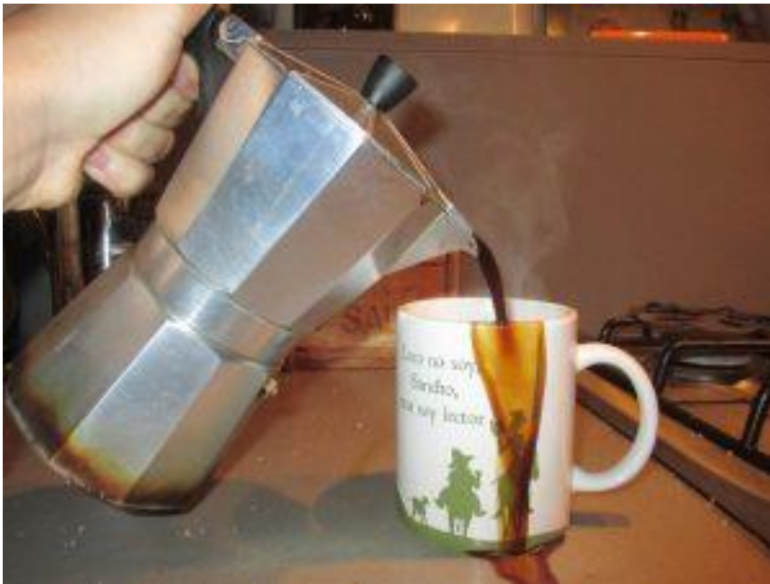
Error de càlcul

El títol és important i resumeix la intenció matemàtica.