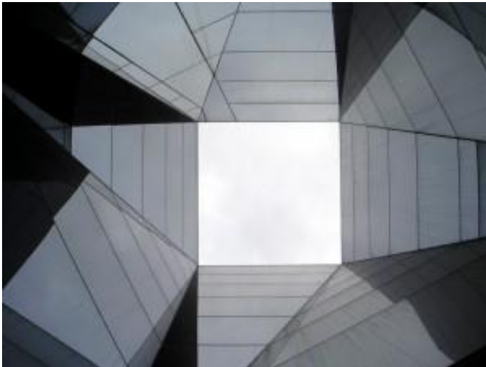
Quadrat mirant el cel