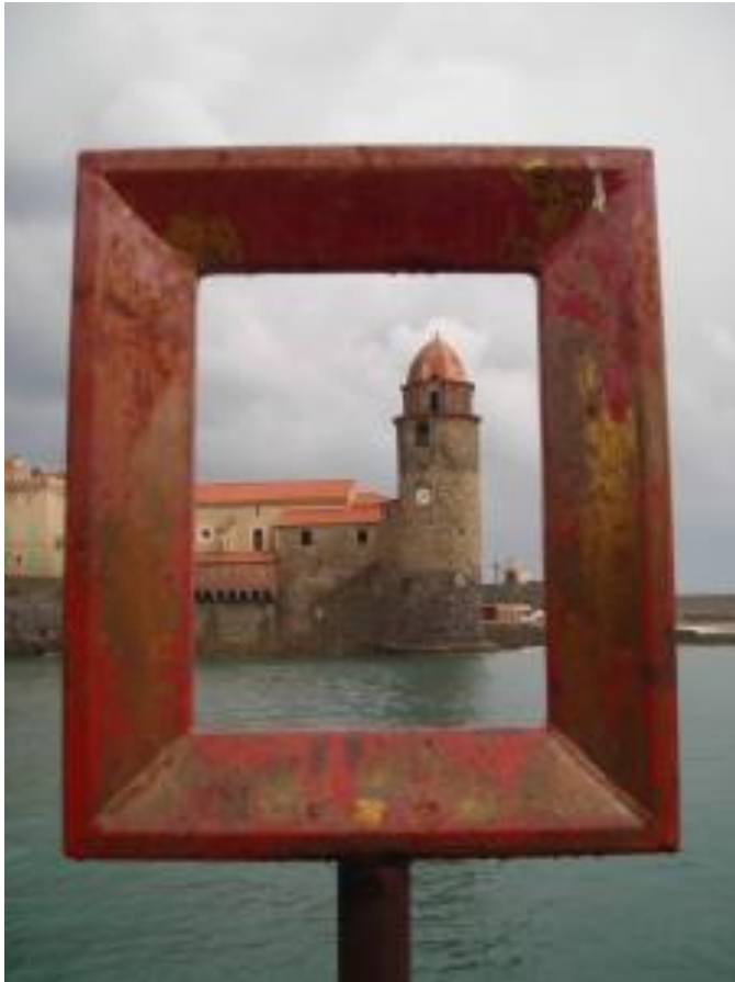
Rectangle amb vistes