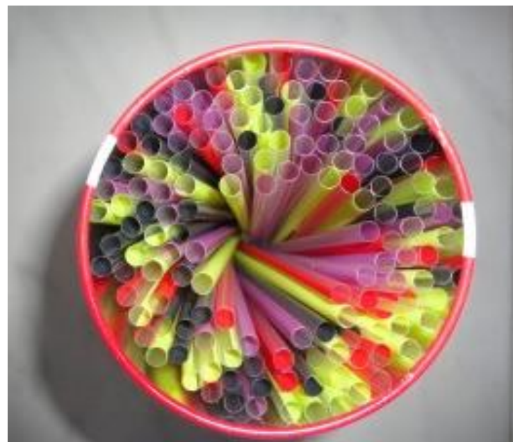
Quina canya de cercle!