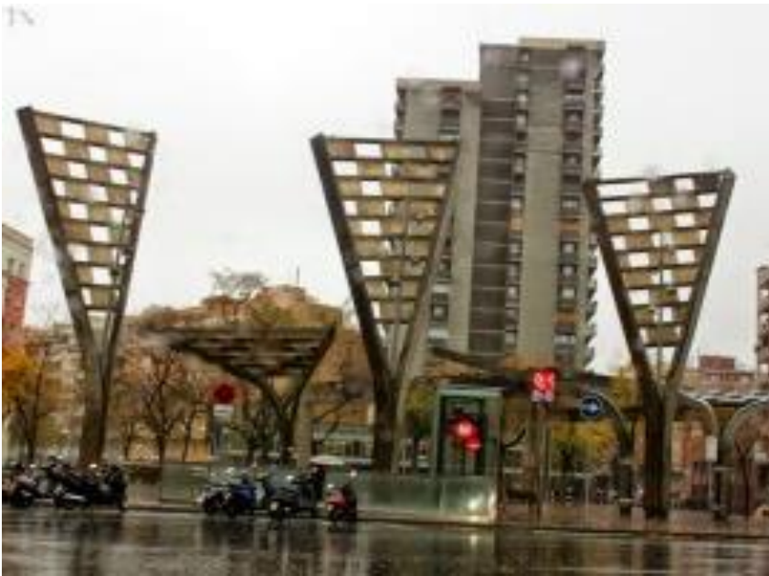
Triangles isòsceles a la plaça