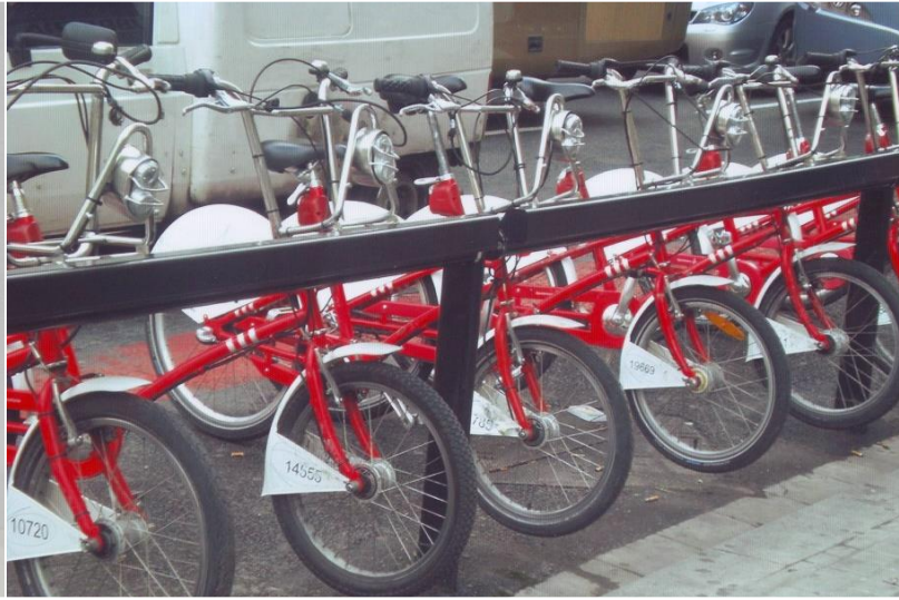
Sèrie de circumferències entre rectangles