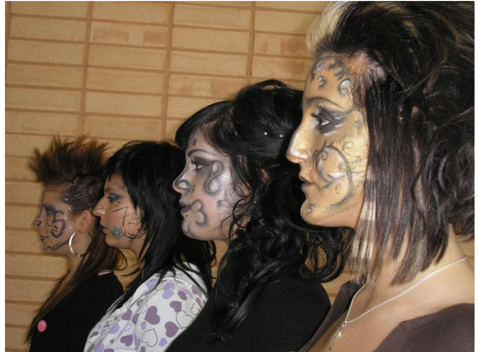
Números amb estil