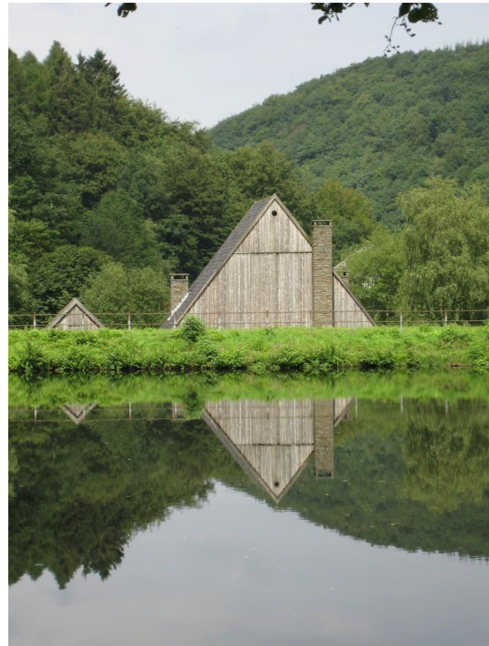
Triangles reals, rombes virtuals