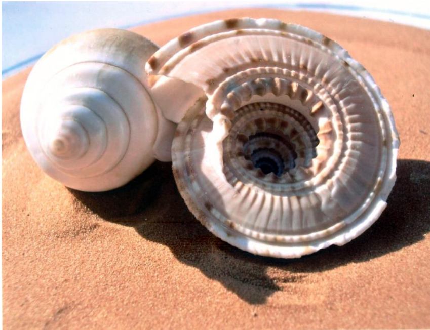
Espirals a la sorra