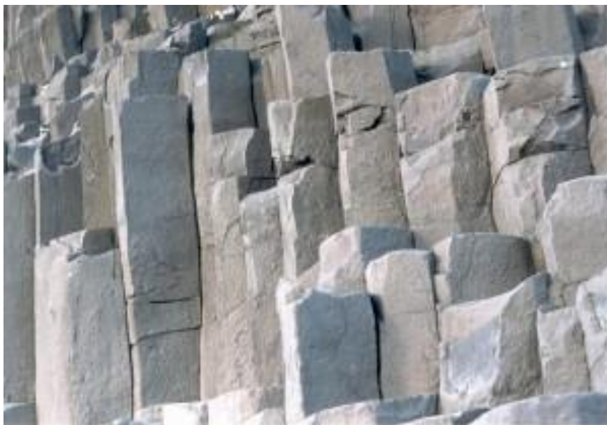
La classe de geometria m'ha deixat de pedra