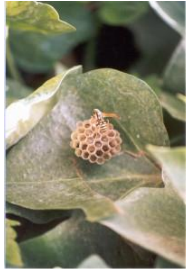
Hexàgons d'una bresca