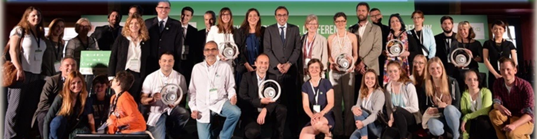
VIII Edicions Premi Europeu de Prevenció Residus

Other SYSTEMIC FOOD DESIGN - UNIV. OF GRIFFITH SCIENCES, ITALY WASTE MANAGEMENT AND REUSE - SPAIN WASTE MANAGEMENT AND REUSE - SPAIN